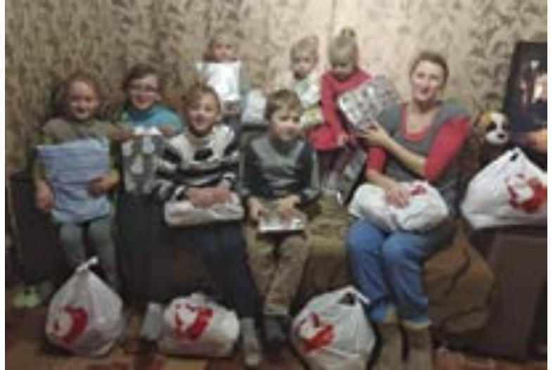
Denne familien kunne feire jul takket være Open Hearts pakker med mat og godterier, samt julegaver til de minste.