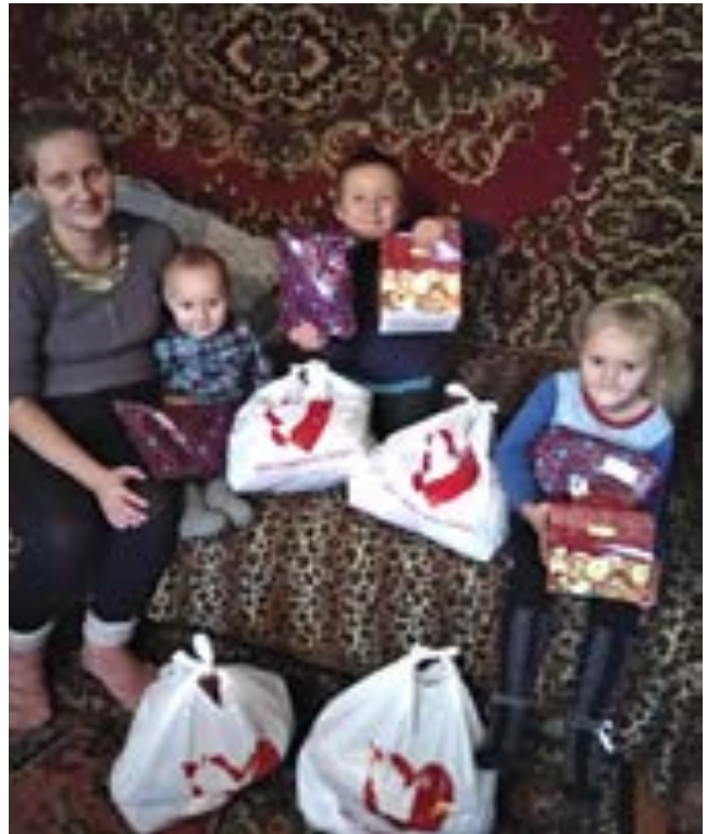
Mamma Natalia smiler, men er tydelig merket av å være sliten og svak etter månedsvis med store prøvelser for familien. De mistet alt i en brann.

I april 2017 brant huset deres ned. Heldigvis var det ingen som ble skadet eller drept i brannen. Det skjedde på kvelden. Moren begynte å lage middag i det lille kjøkkenet da hun plutselig kjente lukten av røyk. Hun gikk ut i det andre rommet og så en fryktelig scene: Hele rommet var full av røyk. I panikk begynte hun å lempe barna ut gjennom vinduet. Det var ingen tid til å engang å tenke på å redde noe av eiendelene deres. Naboer ringte brannvesenet, men den delen av huset hvor familien bodde var totalt nedbrent. De måtte derfor flytte til en annen del av huset, hvor mannens mor bodde. En liten stund bodde familien på ett lite rom. Men da det begynte å regne, raste taket og en del av huset sammen. Familien måtte bo på gata!