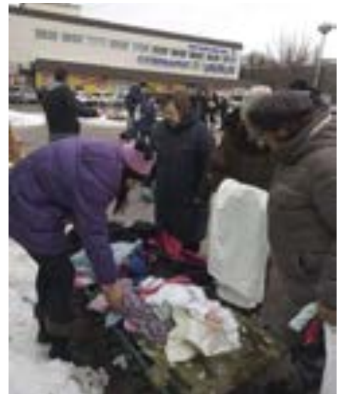
Varme klær redder liv i et iskaldt Ukraina der ingen har råd til å kjøpe nytt.