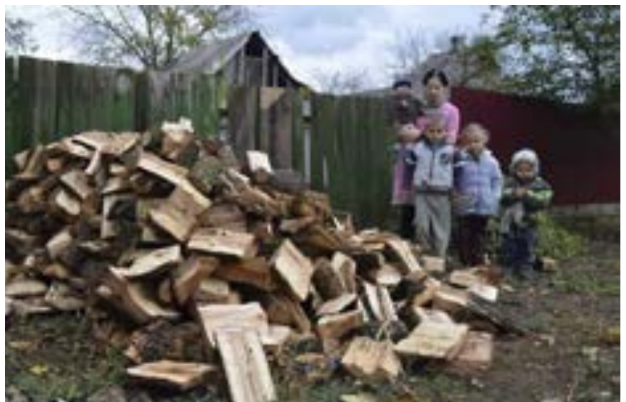
En lykkelig familie har fått ved til å varme opp et iskaldt og trekkfullt hus med. Kalde og ødelagte hus gjør barn og voksne syke. Motstandskraften er svak på grunn av underernæring og sult.