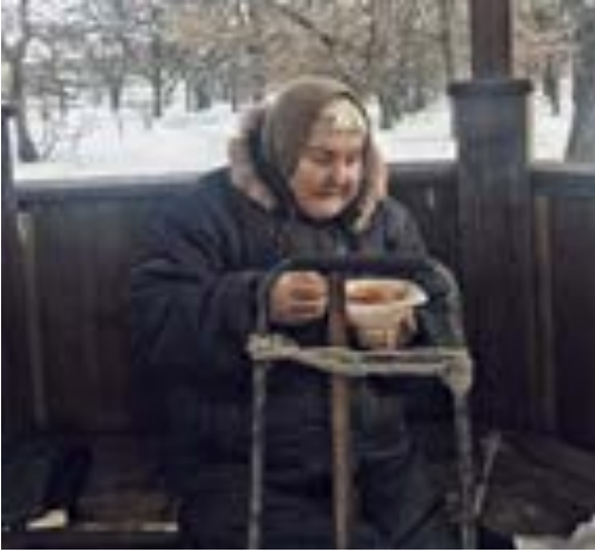
Barna og de eldre lider mest om vinteren i Ukraina. Her har en av de eldre kvinnene fått et livreddende måltid til jul fra Open Heart.