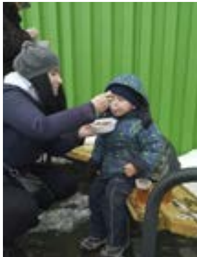
En liten gutt får stilt den verste sulten ved en av Open Hearts suppestasjoner.