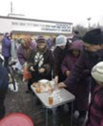
Internflyktninger på grunn av krigsherjingene, har mistet alt. Her får hjemløse og krigsofre mat og klær av Open Heart